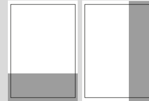
1/3 SEITE QUER ODER HOCH