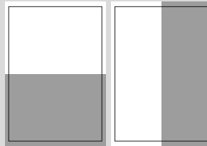
1/2 SEITE QUER ODER HOCH